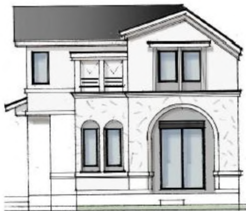
No.5 東南側立面イラスト