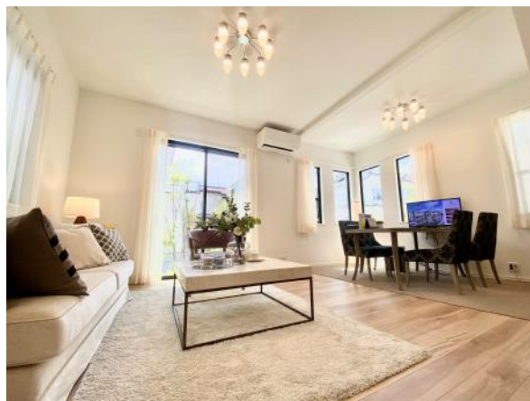
No.5 リビング・ダイニング (2024年6月撮影)