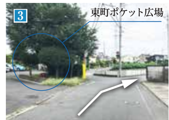
「東町ポケット広場」が見えたら右斜め方向に進み、約510m先右手が現地となります。