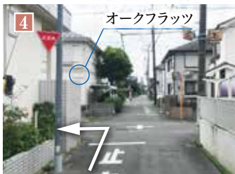
左手に「オークフラッツ」のサインが見えたら手前の道を左折、「東町かえて公園」の先が現地となります。