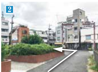
踏切を渡り、商店会のアーチの先を左折します。