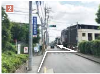
左手に「尾久自動車学校」の看板が見えたら、その先の横断歩道を右側に渡り、さらに直進します。