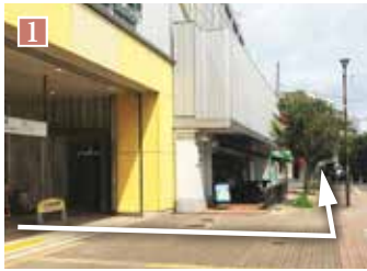
「東小金井」駅南口を出て左折、駅舎沿いに左側を進みます。

徒歩15分 (No.1~3・40~46)、徒歩16分 (No.4~17・28~39)、徒歩17分 (No.18~27)