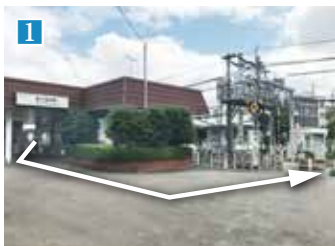
「新小金井」駅改札を出たら左に進みすぐ左折、踏切を渡ります。

徒歩9分 (No.1・45・46)、徒歩10分 (No.2~10・33~44)、徒歩11分 (No.11~32)