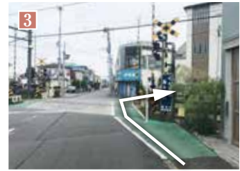
踏切の先に「和菓子司伊勢屋」が見えたら店の右側の道を進みます。