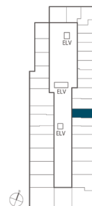
住戸位置概念図 7~10階