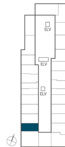
住戸位置概念図 16・18～22・25～29階