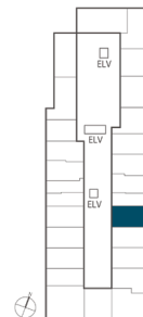
住戸位置概念図 6~23・26~29階