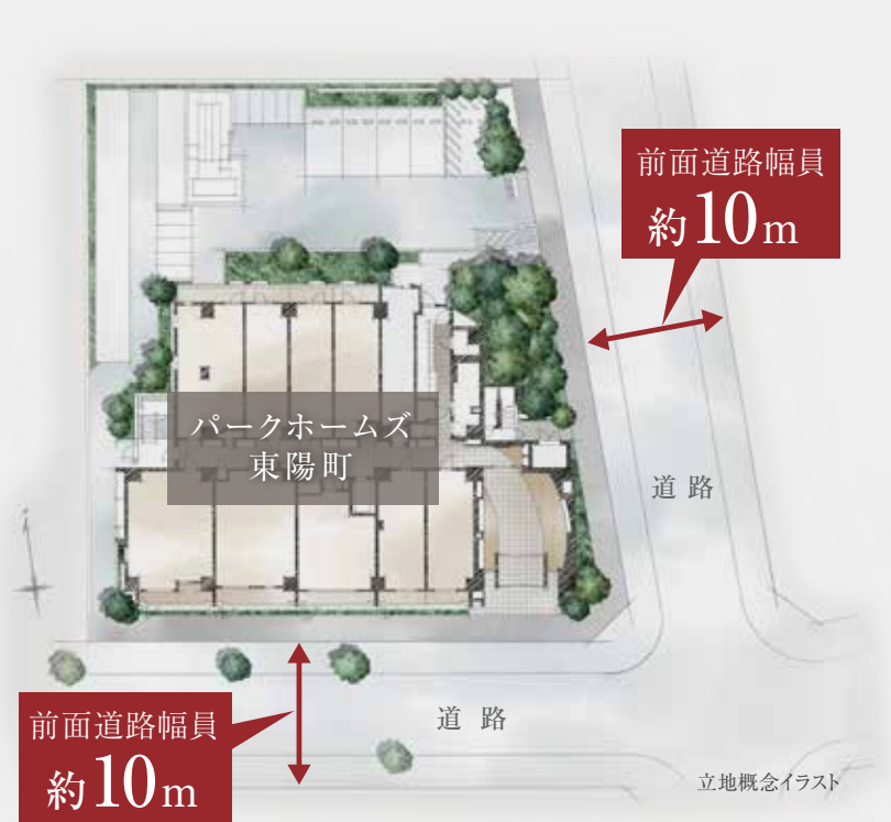
立地概念イラスト

「東陽町」駅徒歩6分(約420m)の地でありながら、落ち着いた住環境に加え、南面と東面に約10m幅の道路を持つ整形角地が、快適な開放感をもたらします。 さらに敷地内でも建物をセットバックさせ、ゆとりある配棟計画を実現。日当たり、眺望などにも配慮した、誰にとっても居心地いいレジデンスがここに誕生します。