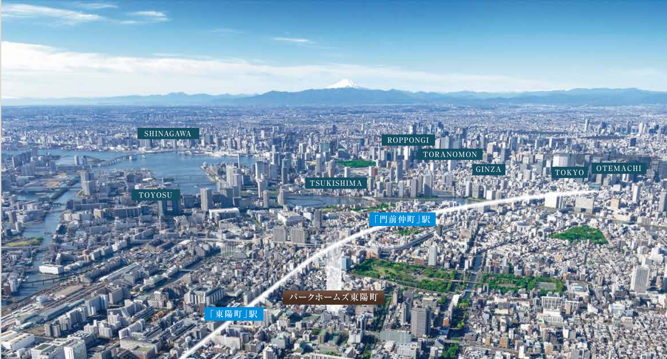
現地周辺航空写真(2022年11月撮影)