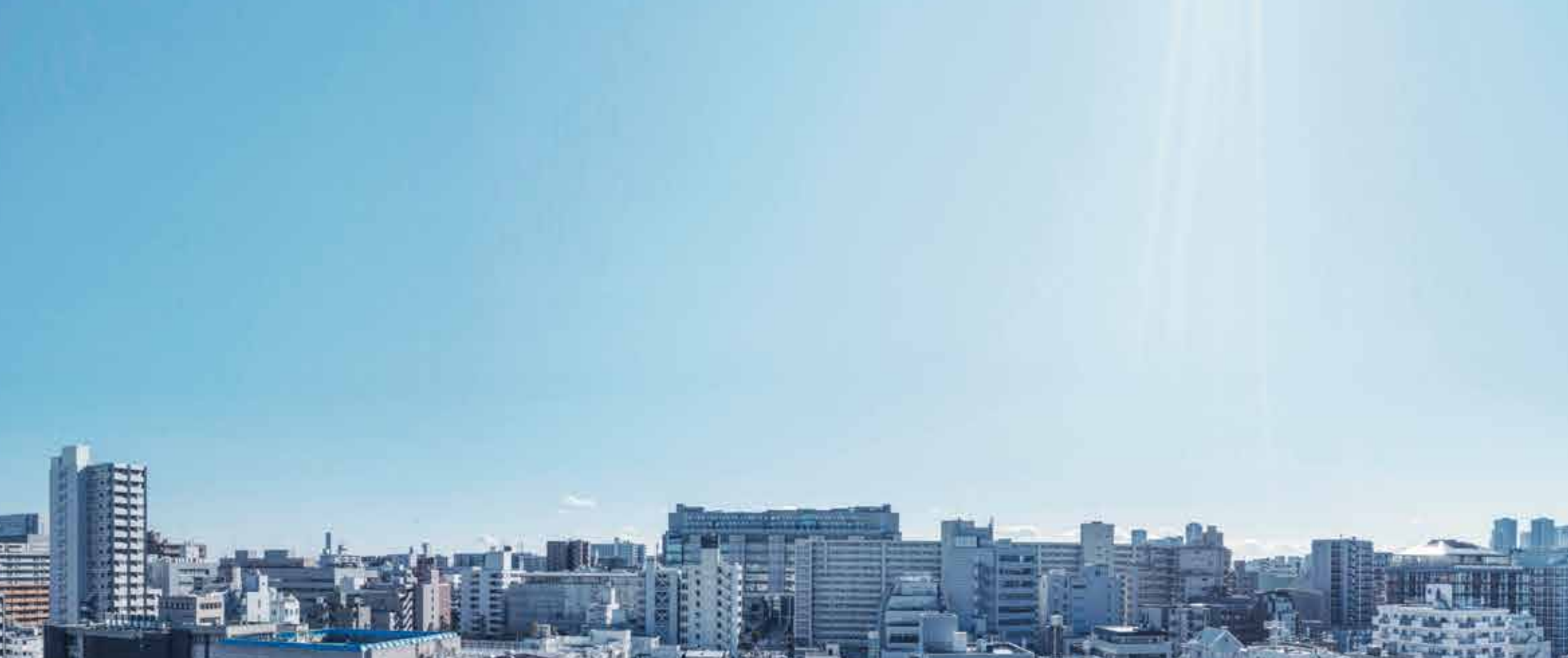
眺望写真※現地11階相当より南方向を撮影(2022年12月撮影)