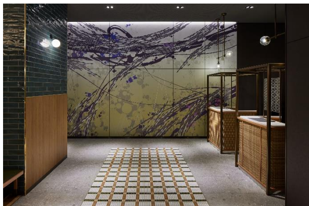
【ロビーレセプション】

開放感ある大きな窓から差し込む自然光と洗練されたインテリアに囲まれて、心地良い癒しのひと時をお過ごしいただけます。