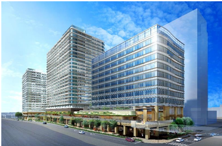
【全体完成予想 CG】 ※今後変更となる可能性がございます。

引き続き、権利者の皆様と連携を図り、多様な人々が集い出会うコミュニティの拠点となる魅力あふれる空間を創出し、活気ある街づくりに取り組むとともに、持続可能な社会の実現に貢献してまいります。