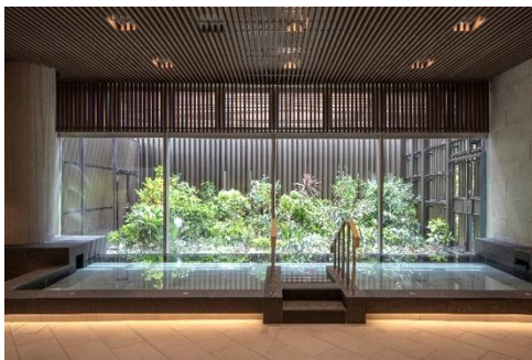
ガーデンスパ（大浴場）

また、約 260 席のダイニング ※3 は、外庭の緑と水景を臨めるメインダイニングだけではなく、中庭の緑やライトアップを眺めながらお酒を楽しめるガーデンバー、テラスなど、特色の異なるエリアを設けることで、その日の気分に合わせて自由に食事を楽しむエリアを選ぶことが可能です。テラスでは、ペットと一緒に食事していただくことができ、株式会社 PETOKOTO と連携した無添加自然素材のペット向けの食事をご用意しています。その他にも、書店「文喫」がプロデュースするパークウェルステイトシリーズ最多の蔵書数 2100 冊以上を誇るライブラリーや、公園を臨むフィットネスルーム、そして最上階には幕張ならではの海と空を一望できるスカイビューラウンジとパーティールームを設けています。