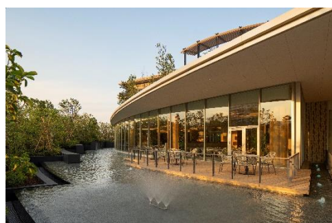
ダイニングテラス