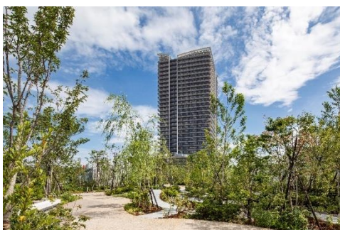
外構（敷地内北西角）

また施設内には、地域に開かれた広大な外庭と、入居者専用のプライベートな中庭・屋上庭園を含め10の庭を設け、館内にいながらも緑を感じることができ、心地よいひとときをお過ごしいただける空間設計となっております。