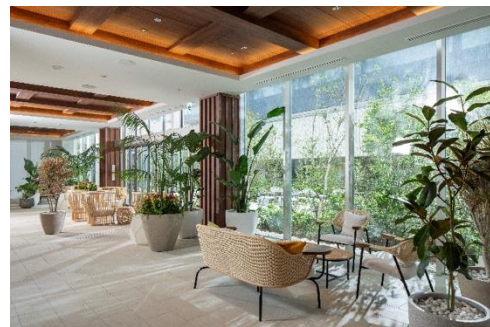
ガーデンラウンジ