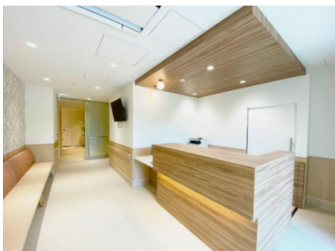
亀田ホームクリニック幕張

さらに、社会福祉法人太陽会による併設介護保険事業所を設置し、介護が必要になった場合でも、介護居室にてお一人おひとりに合った介護サービスが利用できる他、周辺には、幕張ベイパークメディカルセンター、医療法人鉄蕉会亀田総合病院附属幕張クリニック、千葉市立海浜病院、千葉県総合救急災害医療センターなどの医療施設が揃い、もしもの場合にも安心して暮らせる立地環境となっています。