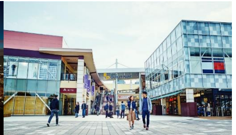
三井アウトレットパーク幕張