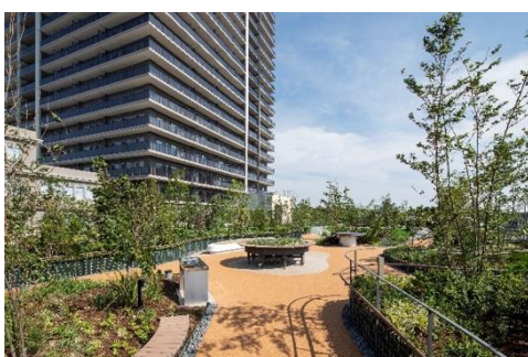
参集の庭（屋上庭園）