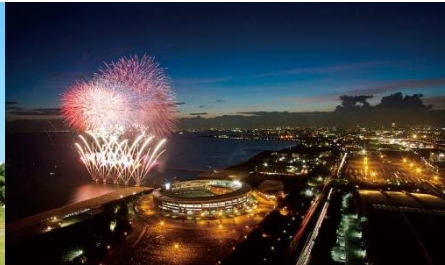
ZOZO マリンスタジアムと花火