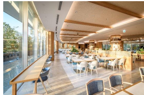
ガーデンダイニング（ウォーターエリア）