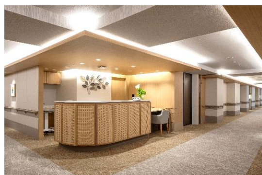
介護フロア：ケアステーション