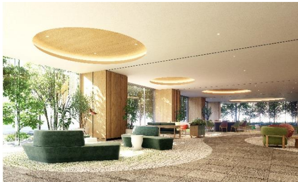
【エントランスラウンジ完成予想 CG】