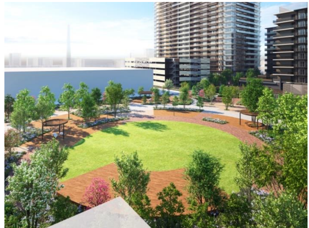
【中央広場完成予想 CG】