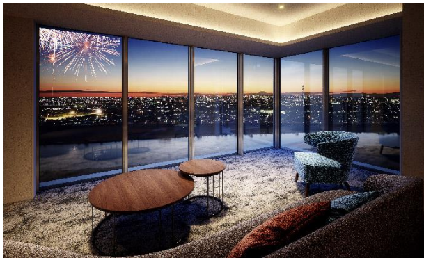
【スカイラウンジ完成予想 CG※6】

本物件では多様化するライフスタイルにお応えするため、多彩な共用空間をご用意。周辺に高層の建築物が少ない開放的な眺望を居住者様にお楽しみいただけるよう、27 階には「スカイラウンジ」を設けました。東京スカイツリー®や富士山に加え、夏になると市川市民納涼花火大会など※5、豊かな風景を堪能できます。また 1 階には「BIG LIVING」をコンセプトとした開放的な「エントランスラウンジ」を設け、「ワーキングラウンジ」や「キッズスペース」とシームレスにつながる空間としました。さらに、ご家族やご友人が宿泊できる 2 つの「ゲストルーム」をはじめ、居住者様のご要望にお応えする「コンシェルジュデスク」、スニーカーや布団まで洗濯可能な「ランドリースペース」、スムーズな入出庫が可能な「自走式駐車場」など、多様化する生活スタイルに対応した、豊かなライフシーンを創造します。