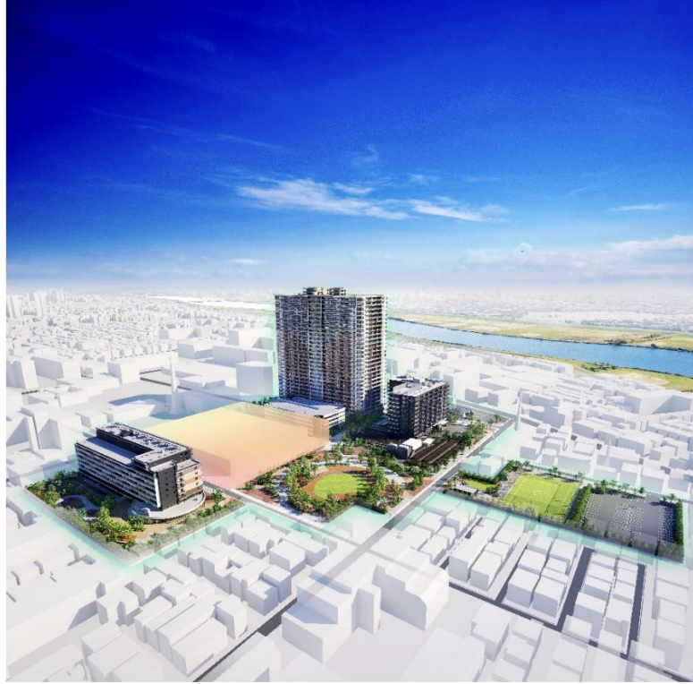
【「リーフシティ市川」全体街区完成予想 CG ※4 】

総武線沿線最大級 ※1 、約 3.7ha の敷地面積を誇る「リーフシティ市川 ※2 」には、日々の利便性や豊かな時間を創出する多彩な都市機能が集結しています。商業施設や地域の住民に開かれた中央広場、気兼ねなくボール遊びを楽しめる運動場のほか、常緑の美しいシンボルツリーやプロムナードの花々といった四季折々の瑞々しい風景が身近に寄り添います。さらに、本物件に加えて、賃貸住宅、シニア住宅をひとつの敷地内に計画することで、多世代型の複合開発を目指しました。