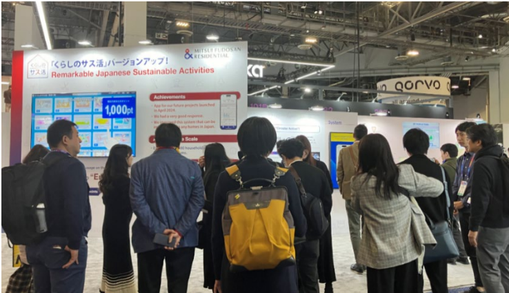
CES2025 当社出展ブースの様子

「CES2025」では、「くらしのサス活」の展示のほか、当社のブランドコンセプトである「Life-styling×経年優化」を体現する開発用地の既存樹を館内備品等に活用する土地の記憶プロジェクトなどのサステナブルな取り組みについて紹介をいたしました。展示会場では来場者がポジティブな印象を持った取り組みに投票する企画も実施し、楽しくカーボンニュートラルに貢献するくらしのサス活はもちろんのこと、当社のサステナブルな取り組みに対して、国内外の来場者から多くの共感をいただきました。