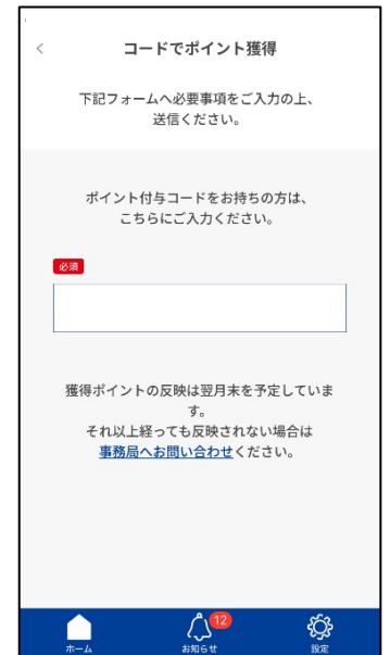
くらしのサス活アプリコード入力画面