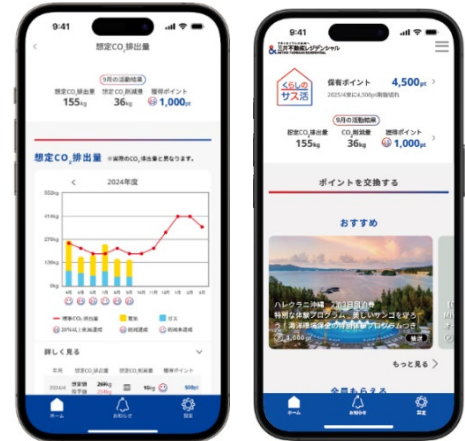
くらしのサス活アプリ画面